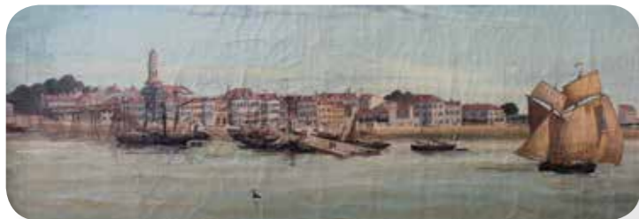
Les quais de Pauillac au XVIIe siècle - Collection privée du Château Pichon Longueville Contesse de Lalande

Deux dessins de l'artiste hollandais Hermann Van der Hem , datés de 1646 et 1647, nous montrent l'aspect de Pauillac au milieu du XVIIe siècle. Le bourg est concentré autour de l'église.