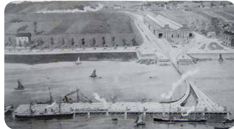
Appontement de Pauillac-Trompeloup en 1895

À partir des années 1950 et 1960, le vignoble du Médoc connaît un véritable renouveau. Pauillac, bien sûr, en bénéficie et ses crus sont encore aujourd'hui très appréciés.