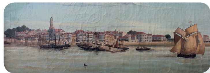
Les quais de Pauillac au XVIII ème siècle - Collection privée du Château Pichon Longueville Comtesse de Lalande

Deux dessins de l'artiste hollandais Hermann Van der Hem , datés de 1646 et 1647, nous montrent l'aspect de Pauillac au milieu du XVII ème siècle. Le bourg est concentré autour de l'église.