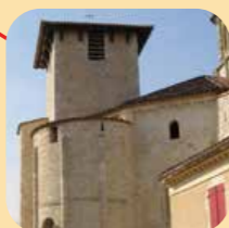
Eglise du XII e à Vertheuil