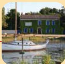
Petit port de la Maréchale à Cadoume