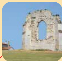
Vestiges de l'abbaye de l'Isle à Ordonnac