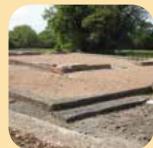
Site archéologique de Brion à Saint-Germain d'Esteuil