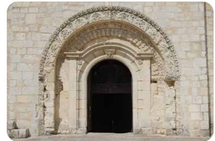
Porche de l'abbatiale