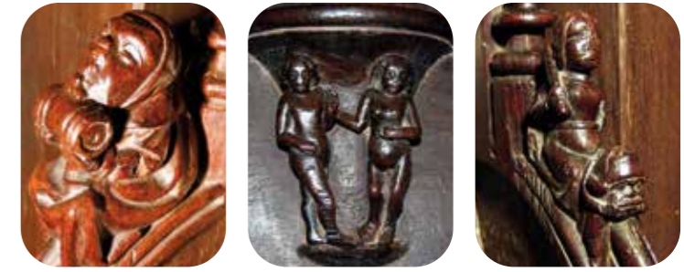
Détails des ornements en bois de l'abbatiale