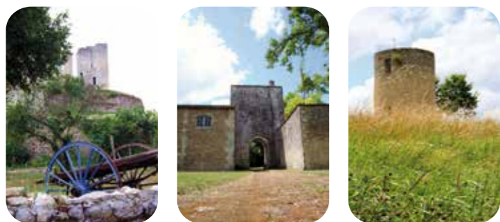
Le château (à gauche et au centre - ne se visite pas), et le moulin (à droite)

Connue depuis 1081, la forteresse occupe un site défensif naturel. Le donjon barlong du XI e siècle (tronqué de moitié durant la Fronde), les murs de la grande enceinte et le soubassement de la tour de guet sont du XI e siècle. La porte de la barbacane dite de l'Audience, a remplacé au XIV e siècle la porte primitive. Le seigneur y exerçait son droit de Haute Justice. La seigneurie fut successivement aux mains des familles de Bourg et d'Albret puis du Chapitre de Saint André. La famille Abadie l'acquiert en 1958, famille dont la généalogie la lie à un certain... Amanieu VII d'Albret, seigneur du château au XIV e siècle.