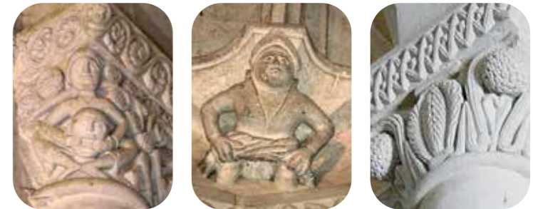
Détails des chapiteaux de l'abbatiale et au centre, un culot de l'abside