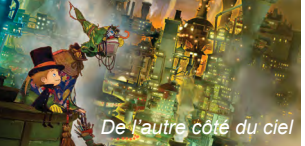
De l'autre côté du ciel