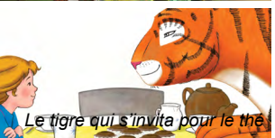
Le tigre qui s'invita pour le thé