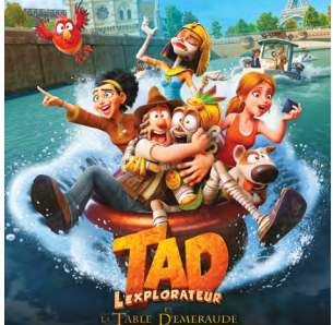
TAD L'EXPLORATEUR ET LA TABLE D'EMERAUDE