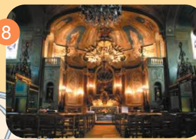
Saint-Estèphe XVIII ème - Baroque rococo